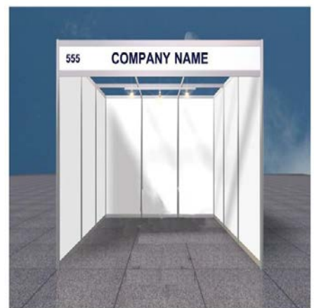
Shell Scheme Stand Sketch (For illustrative purposes only)